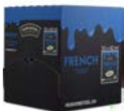
French Dressing 50 x 40ml Artikel Nr. 560232 Gewicht Nettogewicht: 2kg

Zutaten: Wasser, Sonnenblumenöl, Rotweinessig, jodiertes Kochsalz, Gewürzzubereitung (davon Zwiebeln, Knoblauch) Zucker, Kräuter (