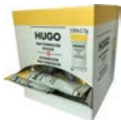
Mayonnaise 100 x 17g Artikel Nr. 560233 Gewicht Nettogewicht: 1.7kg

Zutaten: Sonnenblumenöl, Wasser, Eigelb ((Schweiz) Ei aus Freilandhaltung.), Senf: Branntweinessig, Wasser, Senfkörner, Kochsalz, Zucker, Gewürze,