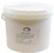
Mayonnaise Gastro 10kg Artikel Nr. 560105 Gewicht Nettogewicht: 10kg