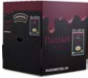
Italian Dressing 50 x 40ml Artikel Nr. 560230 Gewicht Nettogewicht: 2kg

Zutaten: Wasser, Sonnenblumenöl, Rotweinessig, jodiertes Kochsalz, Gewürzzubereitung (davon Zwiebeln, Knoblauch) Zucker, Kräuter (